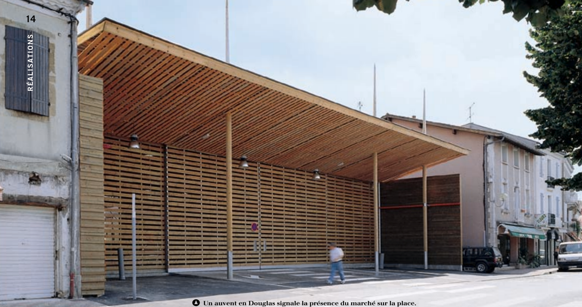
▲ Un auvent en Douglas signale la présence du marché sur la place.