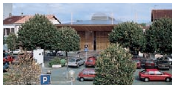
▲ La volumétrie respecte le bâti existant.

La construction du marché couvert, situé au cœur du quartier Saint-Roch, s'inscrit dans un plan d'aménagement global du quartier comprenant le traitement de la place et l'adjonction d'un parking conçu comme un « silo à voitures ». Par sa situation, ce lieu est un accès majeur au centre-ville vers lequel convergent naturellement les flux. Par son usage, c'est un espace d'animation qui accueille le marché ainsi que les différentes fêtes locales et manifestations d'associations. Il s'agissait pour les architectes de respecter les gabarits, la morphologie et la fragmentation des volumes environnants, tout en proposant un outil au service de la ville pourvu d'une grande souplesse d'utilisation. Le projet respecte une image traditionnelle du marché landais tout en développant une forte identité constructive. Le bois, fort de la proximité de la forêt des Landes, est l'élément fédérateur qui apporte une cohérence à cette dualité. Un auvent délimitant un parvis assure la transition avec la ville ; il est formé de consoles et de poteaux fuselés en bois lamellé-collé.