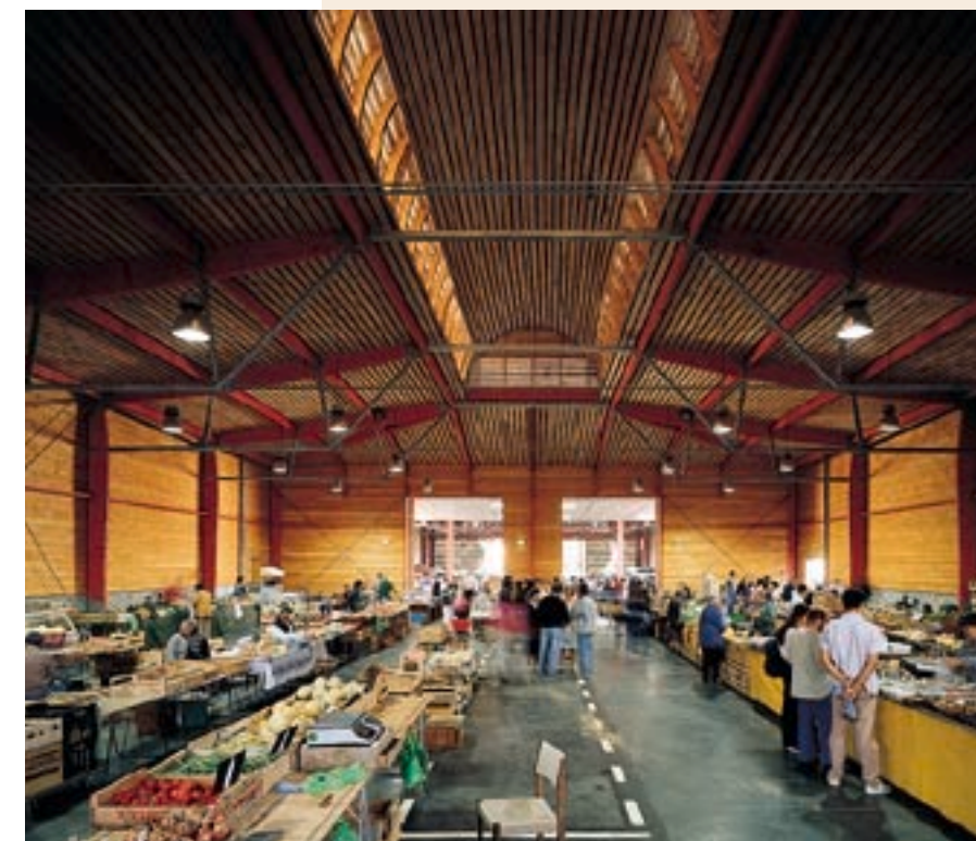
▲ La forte présence du bois crée un espace intérieur convivial, conforme à la tradition landaise du marché.